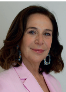
LOLA MOLTÓ MARTÍN Actriz